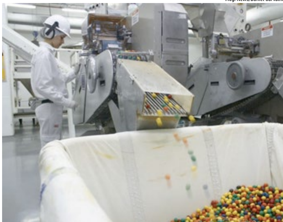
Mogi News/Daniel Carvalho

Os resultados mostram uma recuperação da Indústria e o bom momento vivido para a exportação, motivado pelo câmbio favorável e forte