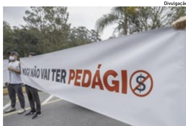
OAB também está envolvida em causas coletivas

Valle informou que a OAB em Mogi está atenta e vem articulando pela interrupção da iniciativa do Palácio dos Bandeirantes, por meio da Agência Reguladora de Transporte do Estado de São Paulo (Artesp). “Evidentemente