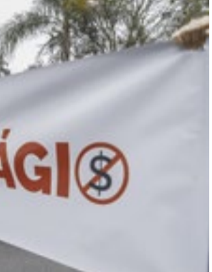
OAB também está envolvida em causas coletivas

o dirigente comentou sobre encontros e diálogos com representantes do Ministério Público e da Procuradoria-Geral do Município, e defendeu que o desfecho da questão deve estar acima da disputa de forças entre os entes políticos. “A resolução desta questão não é uma corrida ou uma disputa.